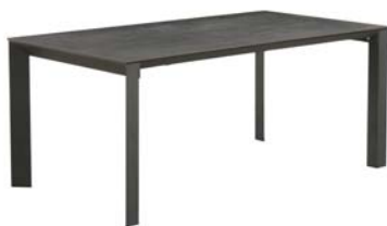
ストームグレイ色