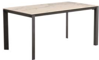
ホワイトクオーツ色