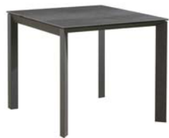
ストームグレイ色

セラミックは、熱・キズ・汚れに強いのが特徴です。焼き物特有の素材感がある為、表面の凹凸や自然な色合い、質感を楽しむことができるのが魅力です。