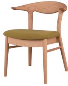
ベルグ ワイドアームチェア