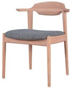
コルノ セミアームチェア